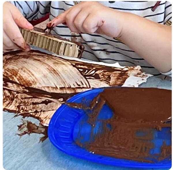
GLI ADULTI PREDISPONGONO E I BAMBINI DANNO SENSO