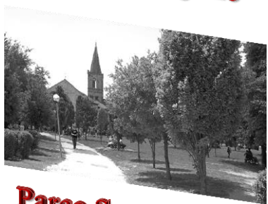
Parco San Giuliana