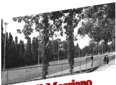
Pian di Massiano