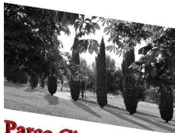
Parco Cico Mendez