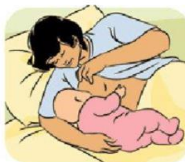
2 - Posizione sdraiata