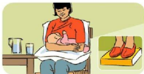
1 - Posizione incrociata