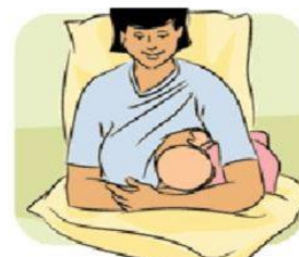
3 - Posizione "a rugby"